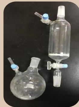
圖1. 過濾器和玻璃瓶

A生於實驗室用硝酸清洗玻璃過濾器，未傾倒使用水及丙酮清洗，使硝酸及丙酮發生反應，導致玻璃瓶內因產生氣體壓力過大而裂開，使化學溶液噴濺至雙眼，欲使用緊急沖淋裝置，其距離超過20公尺且水壓不足。